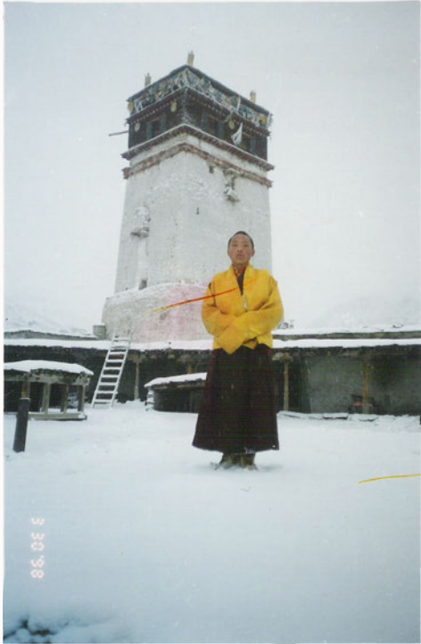
ལ་རྒྱལ་དབང་ཀམ་པ་མཚོག་སྟོན་གནས་ཀྱི་གནས་གཞིགས་སྐབས་སྲས་མཁའ་དགུ་ ཐོག་ཏུ་བསྐྱོན་པའི་སྐབས་ཀྱི་ལོ་ ༡༩༩༩ ལྷ་ ༩ ཚེས་ ༣༠ ལ།

དོས་རྒྱུད་དུས་ལོ་བརྒྱ་གསུམ་ཅེས་དུ་སྟོན་བཀའ་ཏུ་གནས་མཛལ་འགོ་རྒྱ་བྱུང་། མ་གཞི་དོས་པར་ཚུར་འགོ་རྒྱུར་གཞུང་ནས་ དམ་བསྐྱུགས་ཀྱང་ཕྱགས་ཆེན་བྱེད་བཞིན་ཡོད་པས་དགོན་པའི་ནང་དུ་འཇུག་ནས་སྤོན་རྒྱ་དེ་ཡིན། སྟོན་གནས་འཕྲིང་ཅམ་གྱིས་