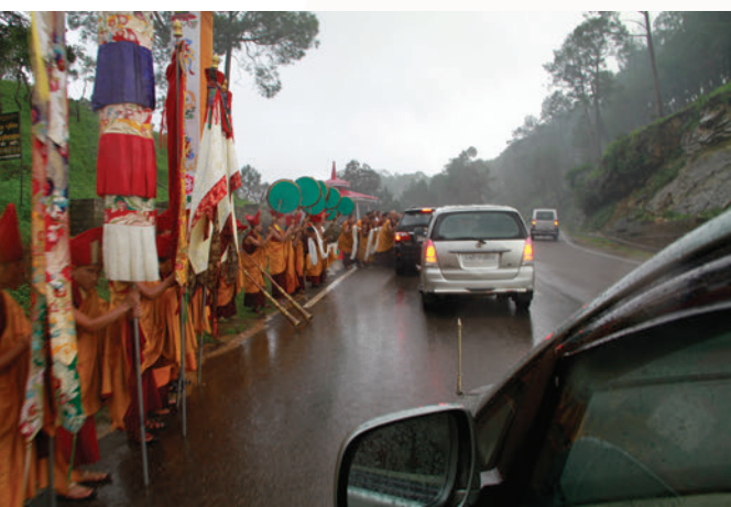
ཐེབས་ལམ་དུ་དབལ་སྐྱུངས་ཐེས་རབ་སྒྲིང་གི་འདུས་མང་ནས་སེར་སྐྱེངས་གྱི་ བསྐྱུ་བ་ཞུག་རྒྱས་པ།

དེ་རྗེས་ཐེབས་ལམ་ཁམས་པ་སྐར་དབལ་ཕུན་ཚོགས་ཚོས་ འཁོར་སྒྲིང་གི་འདུས་སུ་དང་བཀུ་ཤིས་སྒྲོངས་གཞིས་ཆགས་མི་མང་ ནས་ཐེབས་བསྐྱུད་རུ་སྦྱིག་གི་གྲུས་འདུད། ཐེབས་ལམ་ཀང་ར་རྫོང་ ཁོངས་དང་མན་གྱི་འུ་མཚམས་ནས་གདན་ས་དབལ་སྐྱུངས་ཤེས་ རབ་སྒྲིང་གི་འདུས་མང་ནས་སེར་སྐྱེངས་གྱི་བསྐྱུ་བ་གཞུག་རྒྱས་ ཞུས།